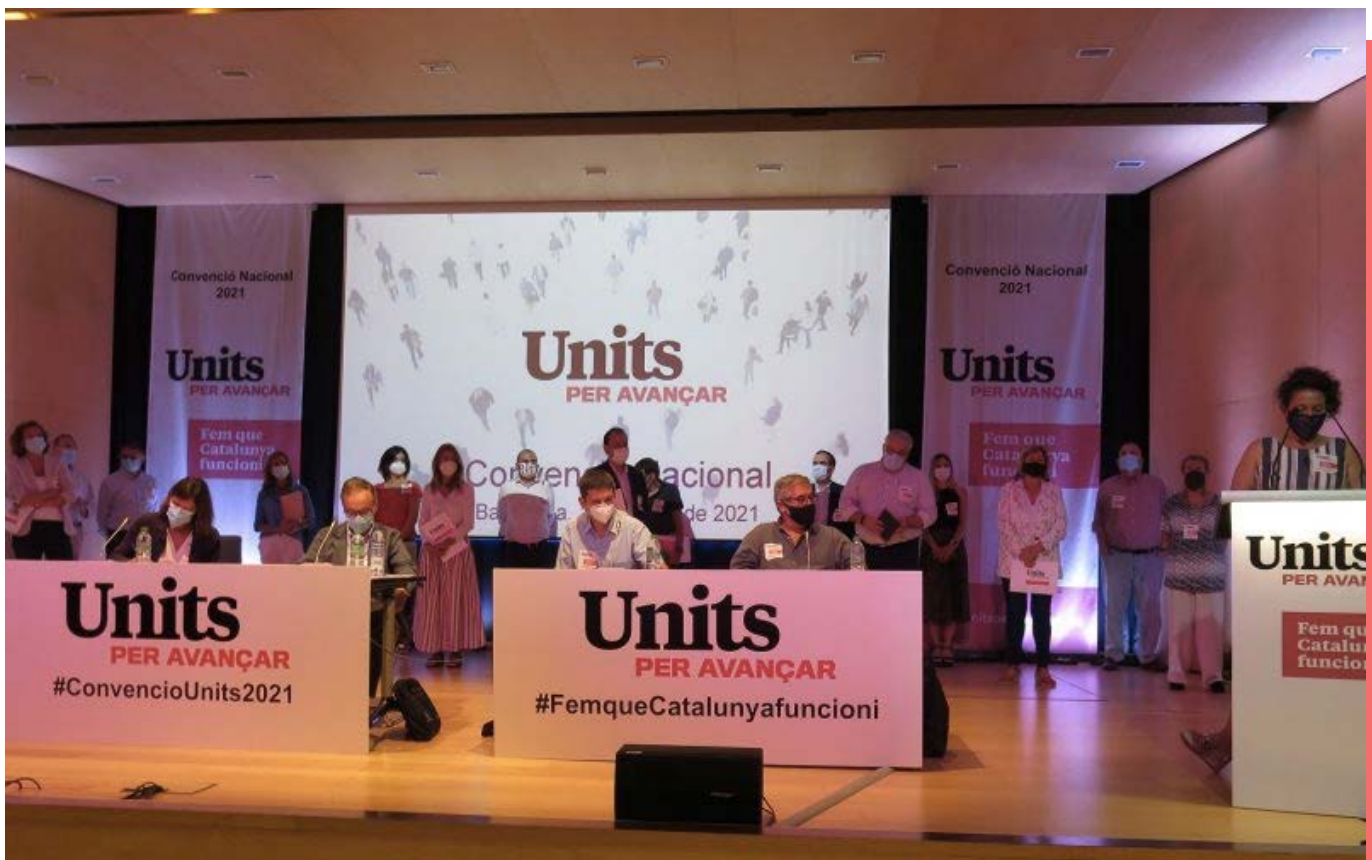
Convenció Nacional d'Units per Avançar.